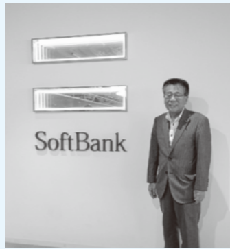
ソフトバンク本社にて

最後に今後とも、さらなるご指導ご鞭撻ご叱咤を賜りますようお願いを申し上げます。貴台始めご家族皆様方には、ご自愛専一に、ご健康とご多幸を心よりご祈念申し上げます。ご挨拶といたします。