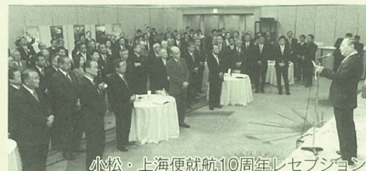
小松・上海便就航10周年レセプション